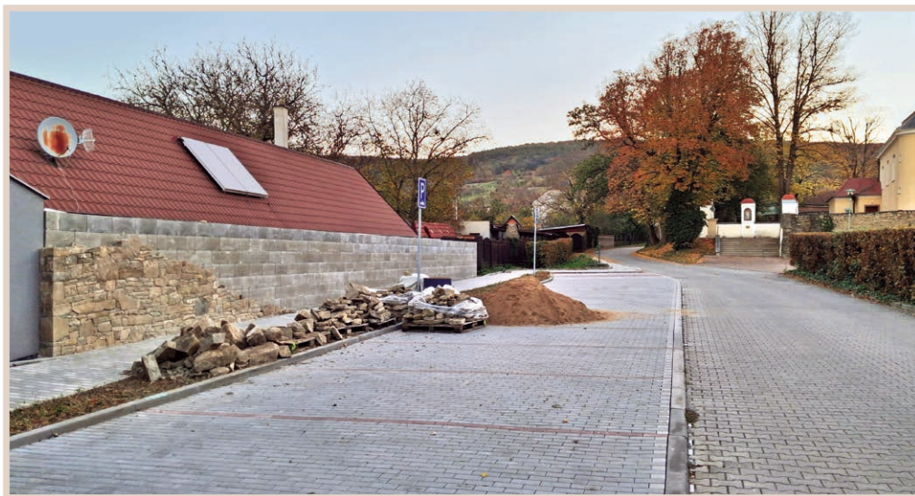
Kamenná zeď u kostela

O aktuálně probíhajících stavebních akcích a opravách. Nadále probíhá budování další části obecního vodovodu směrem na Javorník, vodovodního přivaděče na Strážnou hůrku, rekonstrukce chodníku na náměstí, rekonstrukce kanalizace v ulici Podloší, rekonstrukce objektu č. p. 140 a budování kamenné zdi podél parkoviště před kostelem.