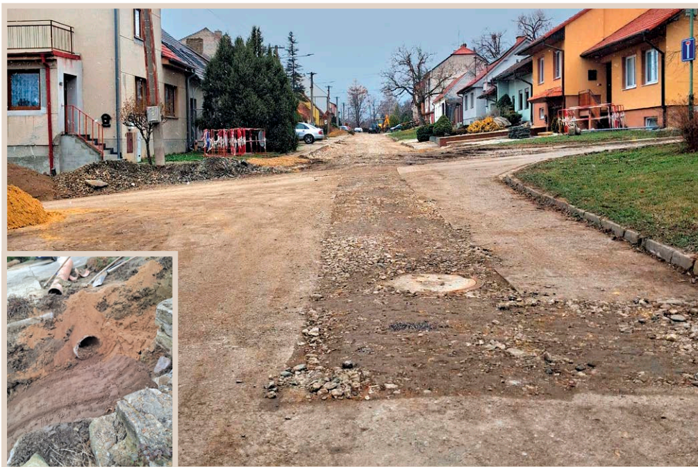
Ulice Podloší, rekonstrukce kanalizace