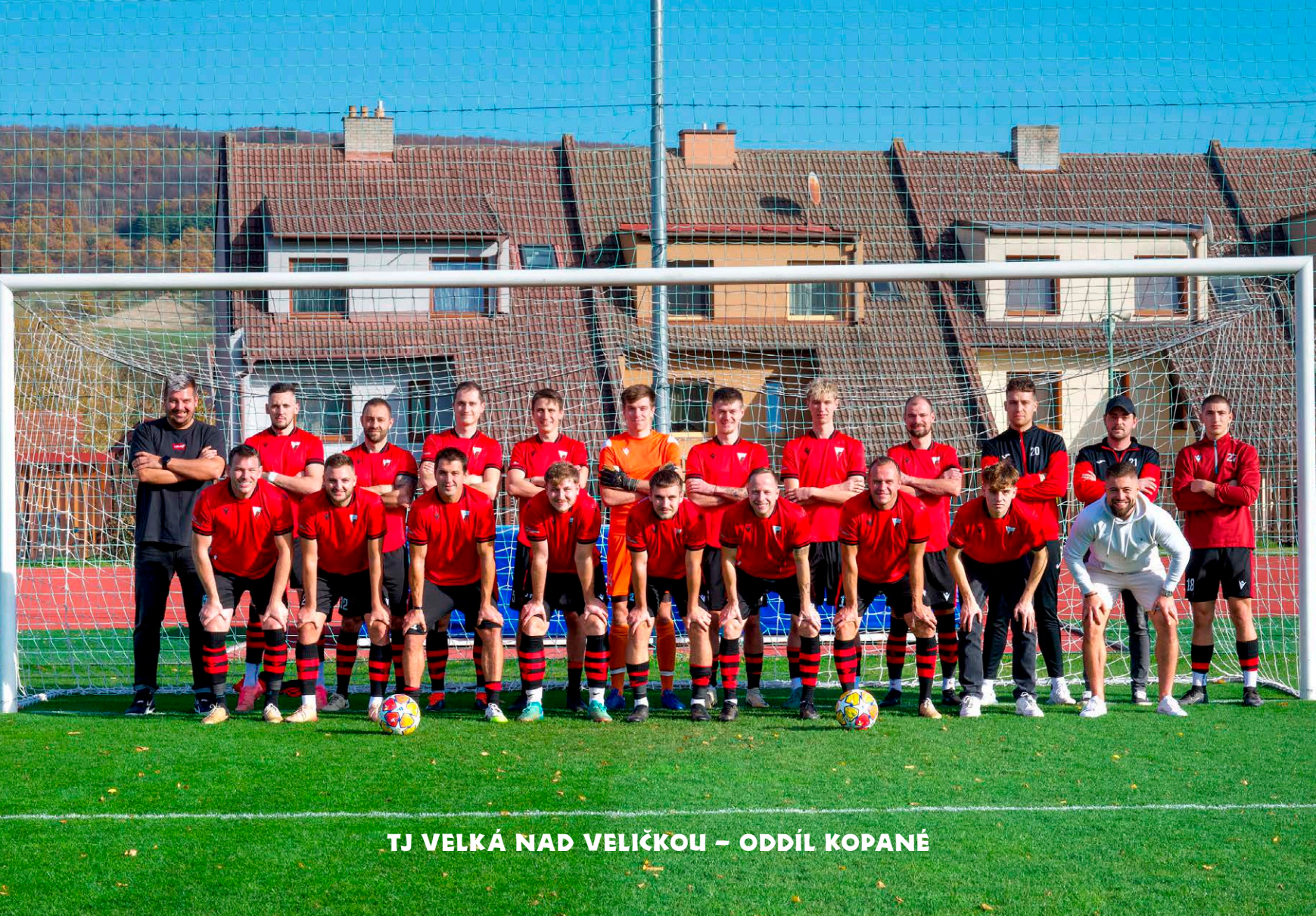
TJ VELKÁ NAD VELIČKOU – ODDÍL KOPANÉ