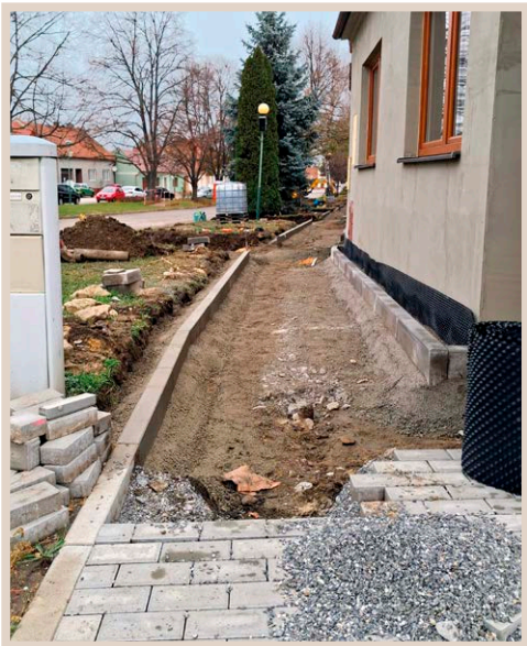
Chodník na náměstí

a uzavření nájemní smlouvy s novým zubařem, čímž se významně rozšíří občanská vybavenost v naší obci. Radou obce bylo doporučeno schválit zastupitelstvem obce